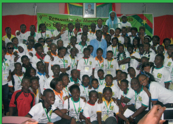
Participants et partenaires à la 9 ème Rencontre à Ouagadougou