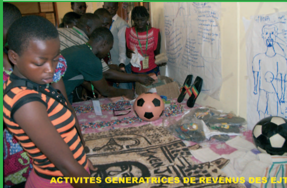
ACTIVITES GENERATRICES DE REVENU DES EJT