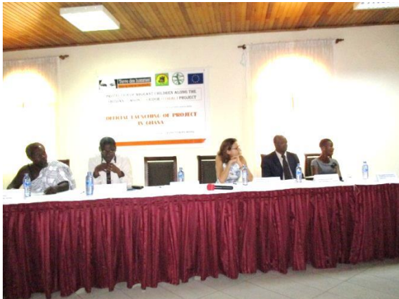
La table d'honneur, au milieu, la représentante de l'UE et à côté, le Coordinateur Régional CORAL

L'objectif de ce lancement est d'assurer la visibilité du projet CORAL au Ghana et mobiliser les acteurs de protection des enfants au tour du projet.