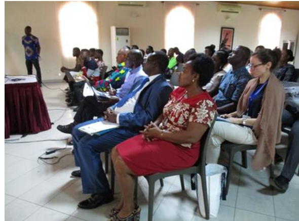
Les participants et l'équipe Tdh Togo

Ils étaient 64 participants des organisations nationales et internationales de protection des enfants dont l'Union Européenne, la Direction Générale des Affaires Sociales, la Direction Générale de la Protection de l'Enfance, Organisation Internationale de la Migration (OIM), la Direction de Police du Ghana chargée de la lutte contre la traite, le Service d'Immigration du Ghana, le Réseau Afrique de l'Ouest pour la protection des enfants (RAO) Ghana, les députés des assemblées communales, la chefferie traditionnelle, le comité de gestion du projet CORAL Ghana ainsi que les représentants de chaque localité du projet au Ghana à prendre part à cette importante cérémonie.