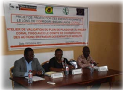
A l'ouverture des travaux par le Chef de Bureau Tdh Togo