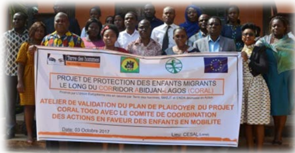
Les membres du CCAEM ( Le groupe de plaidoyer CORAL Togo)

Le projet de protection des enfants migrants le long du Corridor Abidjan Lagos dénommé CORAL , conjointement mis en œuvre par Terre des hommes, MAEJT et ENDA Jeunesse Action et financé par l'Union Européenne, a été encore au centre d'une rencontre importante le 3 octobre 2017 entre les partenaires de protection de l'enfance au Togo, regroupés au sein du Comité de Coordination des Actions en faveur des Enfants en Mobilité (CCAEM) , le groupe de plaidoyer au Togo pour la protection des enfants en mobilité.