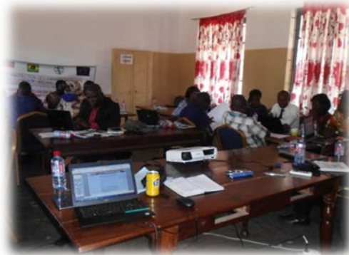
Les travaux de groupe

Etaient également à cet atelier, les journalistes des médias d'Etat et privés à savoir la Télévision Togolaise, Togo presse et radio Kanal FM, membres du réseau des journalistes de protection des enfants en mobilité qui ont procédé à la couverture médiatique.