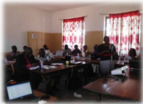
La présentation de la présidente du CCAEM